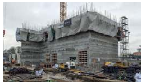
Réalisation d'un Bunker anti explosion Coffrage glissant - 1000 Tonnes - Tavaux