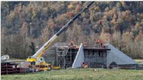
Réalisation d'un TOARC 850 Tonnes - St Bât