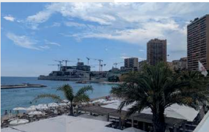
Extension en mer du territoire Monégasque 9 200 Tonnes - Monaco