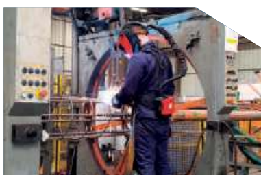
La fabrication d'armature

L'ingénierie des projets est un service complémentaire, des ingénieurs compétents collaborent étroitement avec les clients pour concevoir des solutions techniques adaptées à chaque projet. Leur expertise permet d'optimiser les méthodologies de réalisation et de garantir leur solidité et leur durabilité.