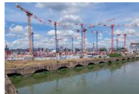
CHU Nantes 8000 ML de boîtes d'attente