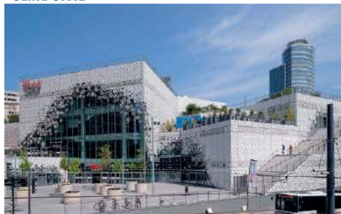
Extension centre commercial - Part Dieu 4500 Tonnes - Lyon