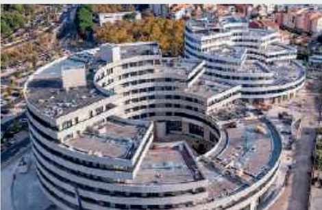
ICONIC 600 Tonnes - Agde