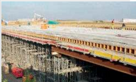
Réalisation d'un TOARC 1 200 Tonnes - Roissy