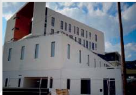
LA LOUBIERE 400 Tonnes - Toulon